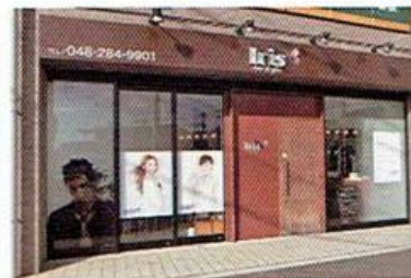
HairStudio IRIS(アイリス) 埼玉県川口市南郷ヶ谷6-4-4 1F TEL:048-284-9901 http://www.bbs-co.com/iris/