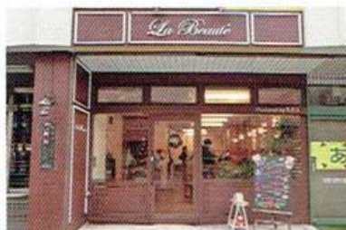
HairStudio La Beaute(ラポータ) 東京都北区王子5-5-3 トウボリスカイビル1F TEL:03-3913-4998 http://www.labeaute.jp/