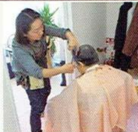
▲60周年記念式典・祝賀会にて撮影