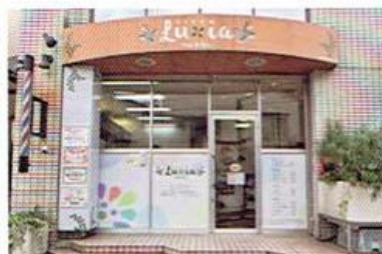
HairStudio Luxia(ラクシア) 東京都北区王子本町11-1-21 権現ビル1F TEL:03-5993-4554 http://www.bbs-co.com/luxia/