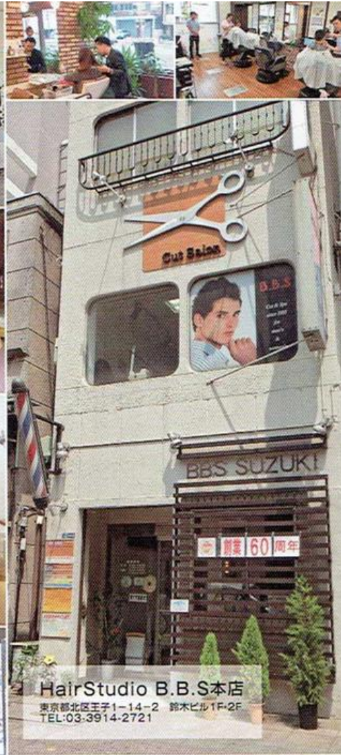
HairStudio B.B.S本店 東京都北区王子1-14-2 鈴木ビル1F-2F TEL:03-3914-2721